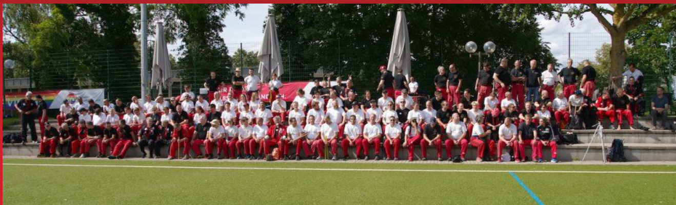
Die Teilnehmerinnen und Teilnehmer des 17. Internationalen Sommerlagers des DAV

Das diesjährige Sommerlager des DAV fand vom 07. bis 13. August 2023 wie mittlerweile schon gewohnt in der Sportschule Schöneck in Karlsruhe statt. Diesmal waren wir leider nicht ausgebucht, aber mit insgesamt über 140 Teilnehmerinnen und Teilnehmern sehr gut besucht. Es waren Sportler/innen aus Frankreich, Ungarn, Österreich, Schweiz, Italien, Israel, USA und Deutschland angereist.