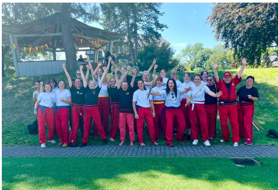
Mehr Frauenpower denn je beim 17. Internationalen Sommerlager