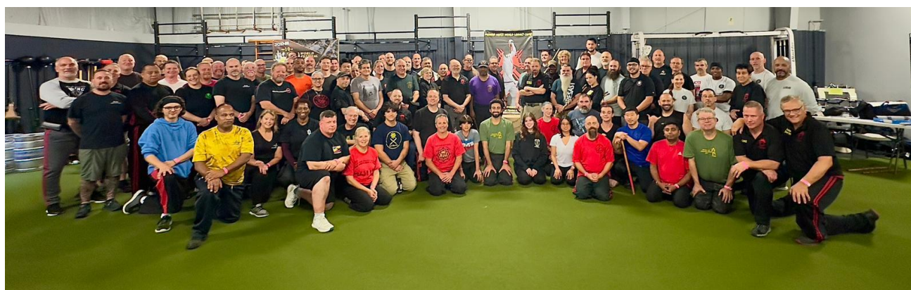
Die Teilnehmerinnen und Teilnehmer des Modern Arnis Legacy Camp