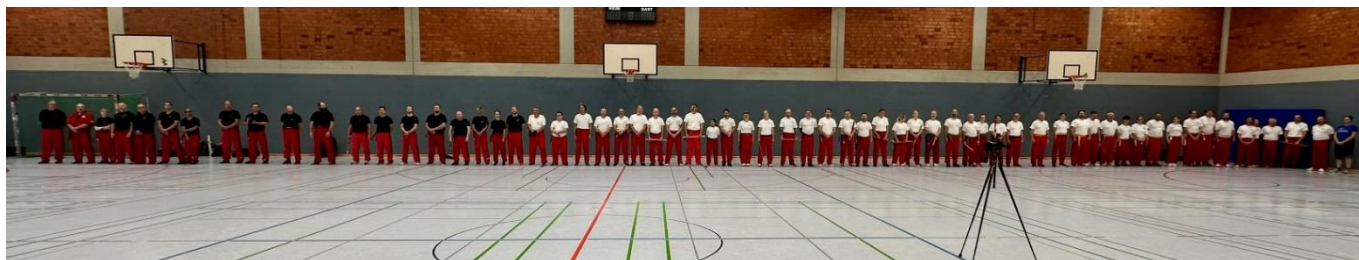
Die Teilnehmerinnen und Teilnehmer des 1. Westdeutschen Modern Arnis Festivals

Am Sonntag fand noch ein Danlehrgang in der Eintracht statt, mit Teilnehmern/innen von Braungurt bis hoch zum 7. Dan. Auch das war ein schöner Lehrgang!