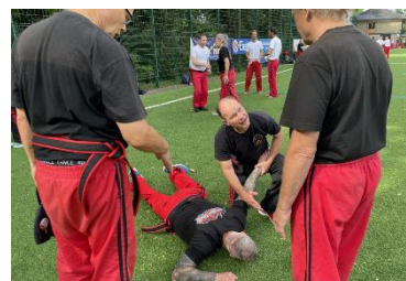
(Bilder vom Sommerlager 2023)